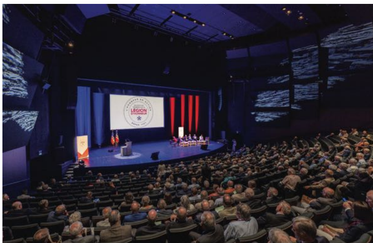
Assemblée générale dans le Centre culturel Quartz de Brest.